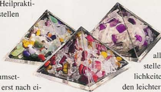
Terramide helfen bei der Entstrahlung des Schlafplatzes

Geistige Begradigung als Aufrichtung des Körpers. Mit geistiger Heiler-Energie, egal ob aus der Nähe oder über weite Entfernungen, kann eine Aufrichtung des Körpers aus seinem Beckenschiefstand, sowie Wirbelsäulenschiefstand, Schulterschiefstand, Beinlängendifferenz und Kopfschiefhaltung erreicht werden. Bei meinen geistigen Heilungen werden die Kunden weder berührt, noch gibt es eine Manipulation durch Magie oder Hypnose. Mit der höchsten göttlichen Energie zur Blockadenauflösung in dem menschlichen Körper kann eine Selbstheilung und Aufrichtung direkt erfolgen. In der kurzen Zeit der energetischen Heiler-Energieübertragung können sich die Personen auf ihre Empfindungen konzentrieren. Vielfach geht mit dieser verkrümmten Körperhaltung der Person auch ein geistig-seelischer Konflikt einher, sodass eine Aufrichtung auch Blockaden lösen konnte. Sollte das zentrale Nervensystem durch Blockaden unterbrochen sein, so ist der Lebensfluss in der Wirbelsäule gestört, und es kann zu gefährdeten Problemen kommen, die ebenfalls Ursache für körperliche Haltungsschäden sind.