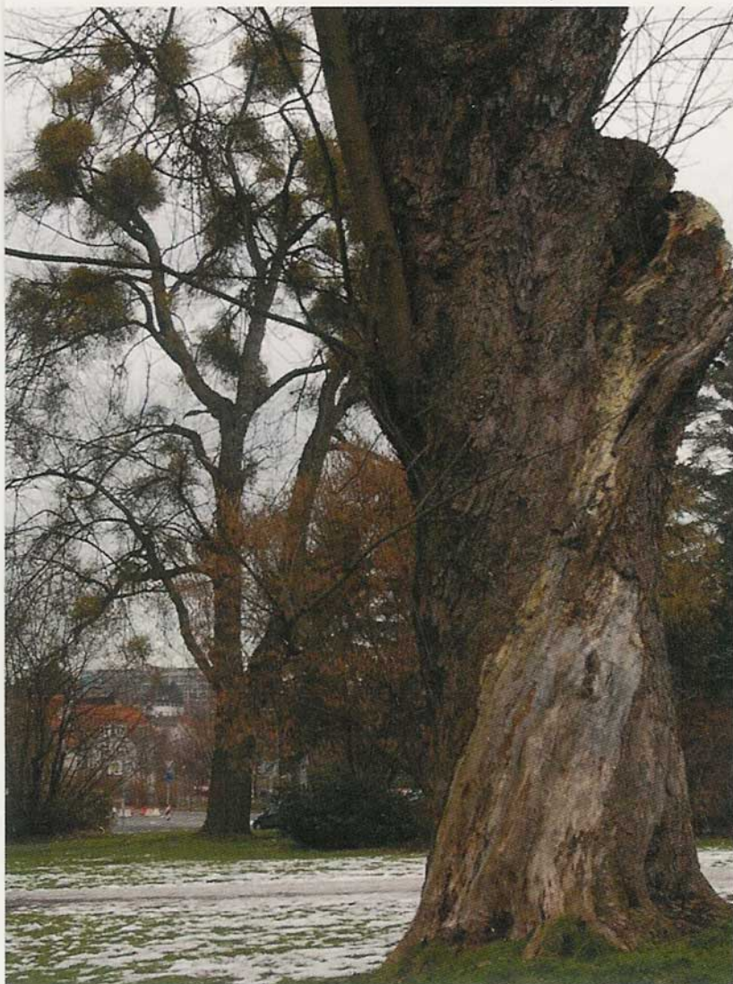
Krüppelhafter Pflanzenwuchs ist ein typisches Zeichen für das Vorhandensein starker Erdstrahlung

Zugestellte TerraMide und weitere energetisch geladene Quarze, Kristalle und Heilsteine für Erdstrahlungsstörungen werden nach einem mitgelieferten Plan, der von mir ermittelten Strahlungslinien, von dem Kunden selbst in dem Schlafzimmer oder der Wohnung ausgelegt. Danach überprüfe ich telefonisch die Richtigkeit der Legung.