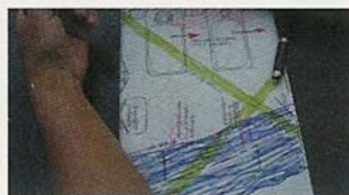
Wasserlinien kreuzen sich und verstrahlen den Schlafplatz

Blockaden abgebaut werden, auch Strahlungen, die der Mensch tagsüber in sich aufgenommen hat, werden über Nacht wieder abgebaut. Von meinen Kunden höre ich immer wieder, dass sie nach einer Entstörung mit Heiler-Energie immer warme Füße und ein angenehmes Kribbeln im Körper verspüren. Dass Sie auch weniger heizen müssen, legt den Schluss nahe, dass der Körper wegen der Erdstrahlenbelastung wesentlich mehr Energie aufbringen musste, die nun nicht mehr nötig ist.