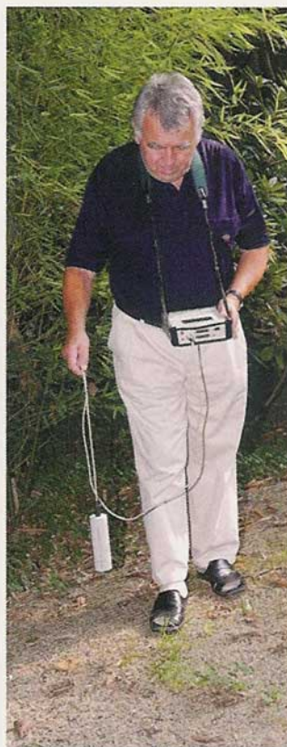
Eine genaue Untersuchung der Umgebung ist wichtig

Eine gelungene Entstrahlung sorgt nicht nur dafür, dass